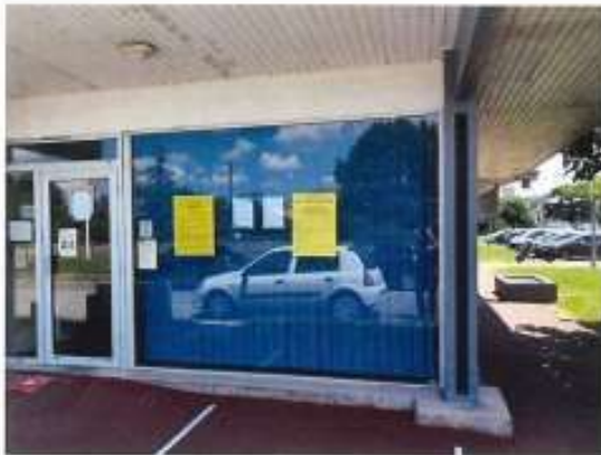
Affichage poste de réjouit à CESTAS-Réjouit