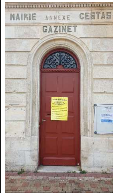
Porte mairie adjointe Gazinet