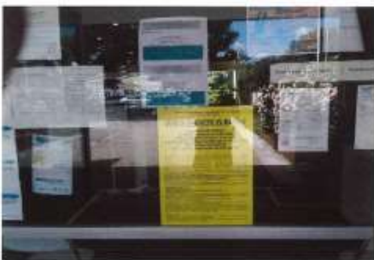
Affichage Mairie de CESTAS