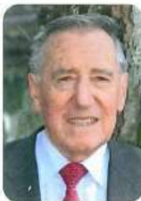
Pierre DUCOUT Maire de Cestas