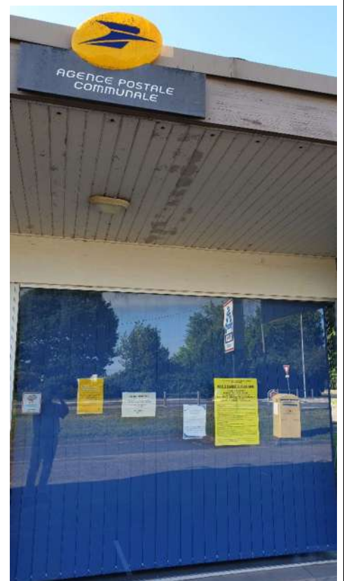
Poste de Réjout