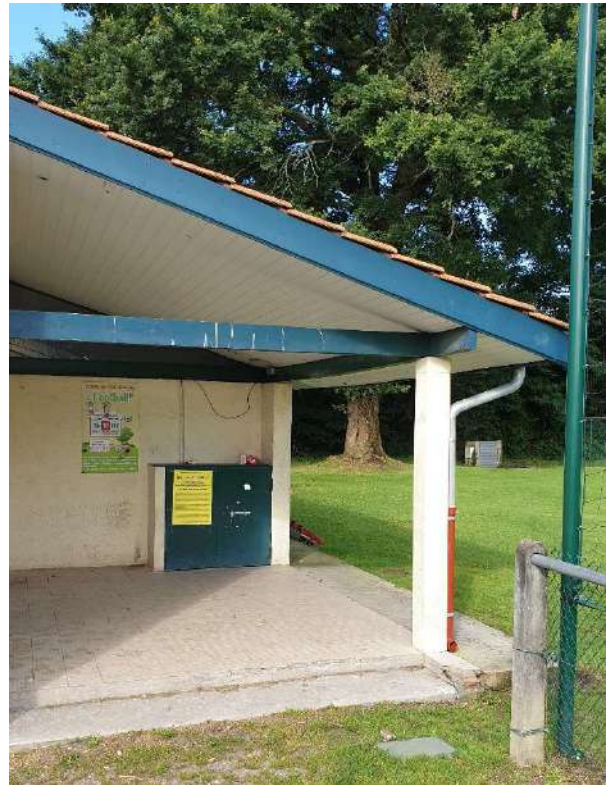
Maison de quartier TOCTOUCAU