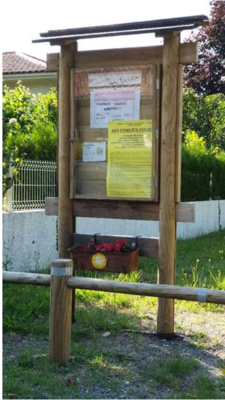
Maison de quartier Pierroton