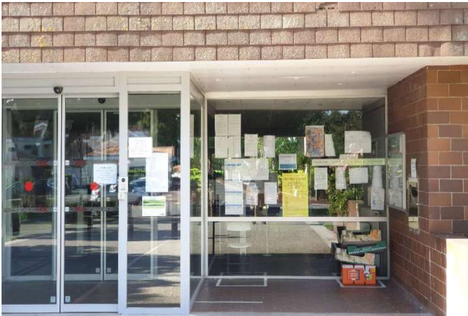
Porte mairie principale