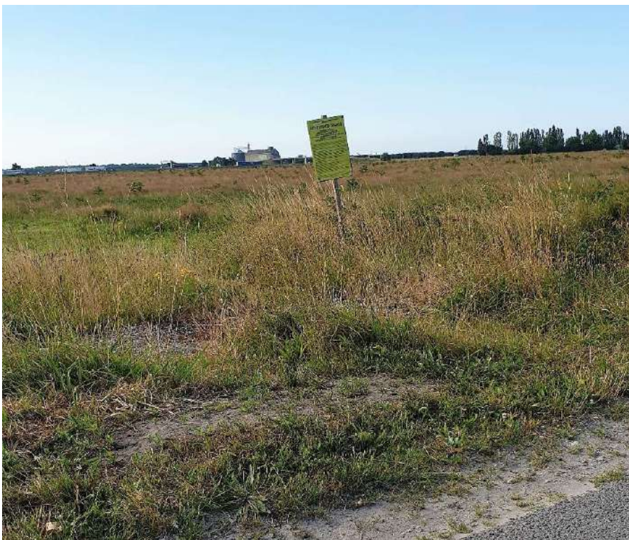
Site du projet