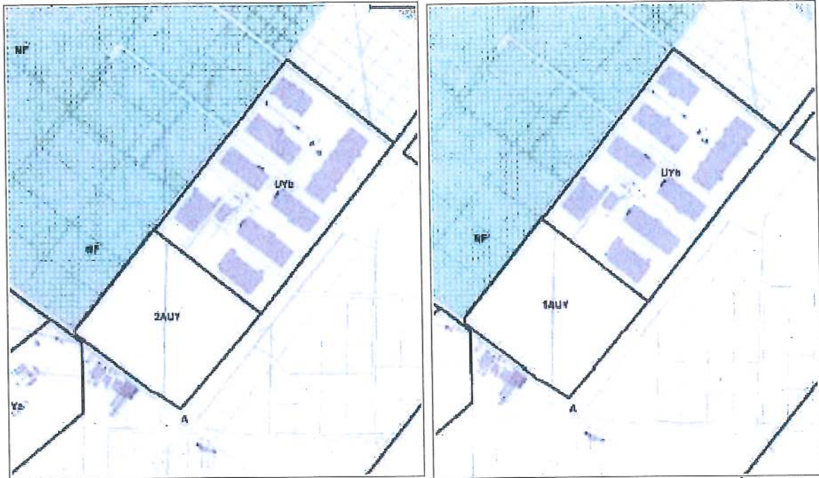
Règlement graphique du PLU avant (à gauche) et après (à droite) la modification

Le PLU actuellement opposable ne comportant pas de zone 1AUUY, la modification porte sur la création du règlement graphique 1AUUY et d'un règlement écrit de sous-zonage 1AUUY qui complète le règlement écrit de la zone 1AU réservée, dans le PLU actuel, à l'urbanisation future à caractère d'habitat.