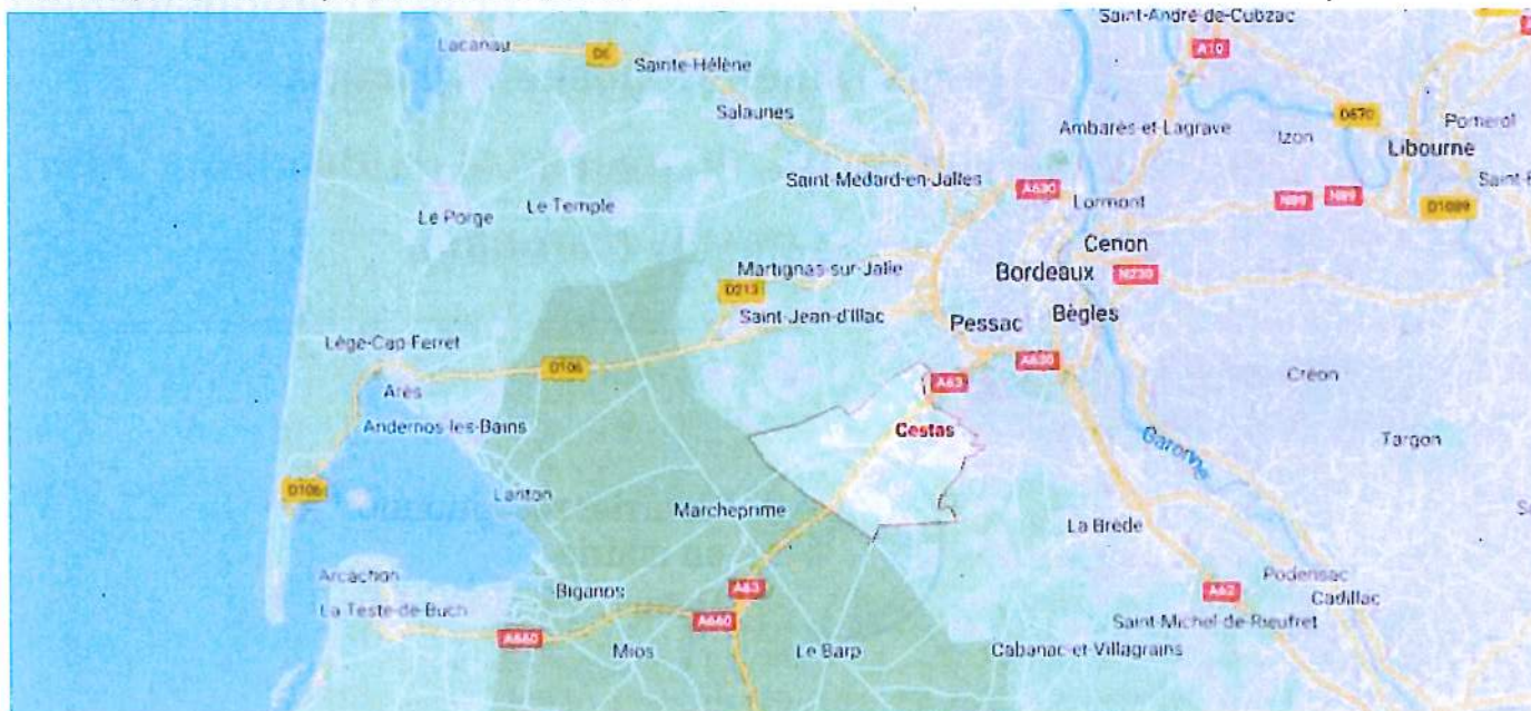
Localisation de la commune de Cestas

L'objet de la présente modification est de permettre l'extension de la zone d'activités dénommée « Pot au Pin », située à environ sept kilomètres au sud-ouest du centre-ville, à proximité immédiate de l'autoroute A63. Cette extension nécessite de reclasser les 52,8 hectares de la zone 2AUY en zone 1AUY à vocation d'activités économiques en modifiant les règlements écrit et graphique et en créant une orientation d'aménagement et de programmation (OAP).